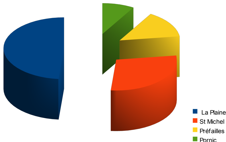
Nombre d'élèves par commune 2009/2010

L'école de musique ABACADA ouvre ses portes en septembre 2005 sous la forme d'une association de loi 1901. Les cours sont dispensés à la Maison des Lakas, à la Plaine sur Mer. Les objectifs étaient de créer une activité de type enseignement musical associatif pour répondre à une attente des familles des communes de la Plaine sur mer, Préfailles, St-Michel.